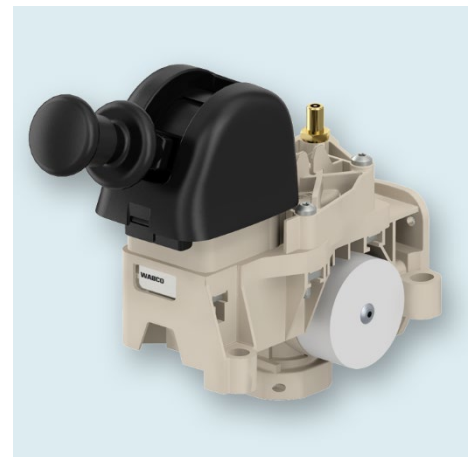
Handbremsventil 961 724 800 0